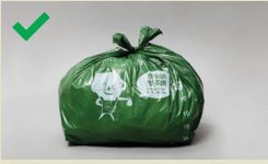
ਬੈਗ ਨੂੰ ਕੱਸ ਕੇ ਬੰਨ੍ਹਿਆ ਜਾਣਾ ਚਾਹੀਦਾ ਹੈ

ਆਪਣੇ ਕੂੜੇ ਨੂੰ ਸਹੀ ਢੰਗ ਨਾਲ ਲਪੇਟਣ ਲਈ ਨਿਰਧਾਰਿਤ ਬੈਗਸ ਦੀ ਵਰਤੋਂ ਕਰੋ, ਵੱਡੇ ਆਕਾਰ ਦੇ ਕੂੜੇ 'ਤੇ ਨਿਰਧਾਰਿਤ ਲੇਬਲਸ ਲਗਾਓ