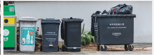
Khu vực đặt thùng rác