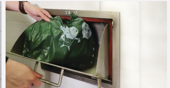
Ống đổ và vận chuyển rác thải trong tòa nhà