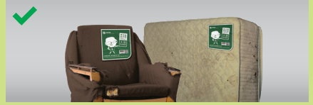
Dán nhãn được chỉ định trên mỗi túi rác thải ngoại cỡ **

**Nếu rác thải ngoại cỡ được “tính phí theo trọng lượng”, vui lòng liên hệ với văn phòng quản lý để thu xếp phí vào cổng và/hoặc phí vận chuyển