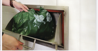
کوڑے کو جمع کرانے والے مقامات کے منحل