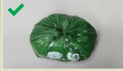
بیگ مضبوطی سے باندھا جانا چاہئے