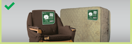
بڑے سائز کے برکوڑے پر مختصیل چسپاں کریں**

** اگر بڑے سائز کے کوڑے کو "وزن کے حساب سے" چارج کیا جاتا ہے، تو براہ کرم گیٹ فیس اور/یا ٹرانسپورٹیشن فیس کی وصولی کا بندوبست کرنے کے لیے مینجمنٹ آفس سے رابطہ کریں۔