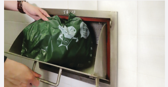
ปล่องทิ้งขยะ