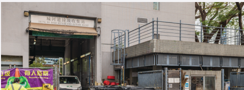
จุดรวบรวมขยะ