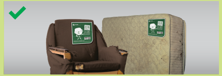
Maglagay ng nakatalagang etiketa sa bawat piraso ng malalaking basura**

**Kung ang napakalaking basura ay "sinisingil base sa timbang", mangyaring dumulog sa tanggapan ng pamamahala para sa pag-aayos ng koleksyon ng bayad sa gate at/o bayad sa transportasyon