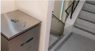
Mga basurahan sa paglapag sa mga hagdanan