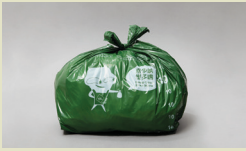
Ang bag ay dapat na nakatali ng mahigpit

Gumamit ng mga itinalagang bag para balutin nang maayos ang iyong basura, idikit ang mga itinalagang etiketa sa malalaking basura