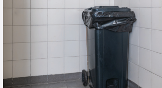
Mga silid tapunan ng basura