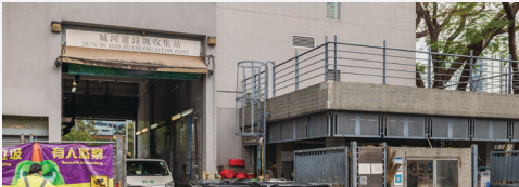
Mga lugar kung saan kinokolekta ang mga basura