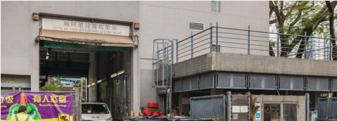
रीफ्यूज संग्रहण बिंदु

खाद्य और पर्यावरण स्वच्छता विभाग के रीफ्यूज संग्रह बिंदु