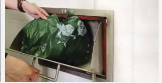
कूड़ेदान के इनलेट

खाद्य और पर्यावरण स्वच्छता विभाग के रीफ्यूज संग्रह बिंदु