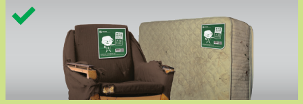
बड़े आकार के कचरे के प्रत्येक टुकड़े पर एक निर्दिष्ट लेबल चिपकाएँ**

**यदि बड़े आकार के कचरे का शुल्क "वजन के आधार पर" लिया जाता है, तो कृपया गेट-शुल्क और/या परिवहन शुल्क की संग्रहण व्यवस्था के लिए प्रबंधन कार्यालय से संपर्क करें।