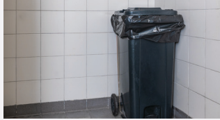
कचरे का कमरा