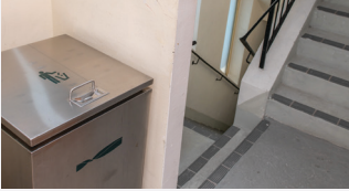
सीढ़ियों की लैंडिंग पर अपशिष्ट संग्रहण डिब्बे

परिसर के सांप्रदायिक अपशिष्ट रिसेप्शन क्षेत्र